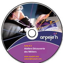
DVD Acte 3 : Ateliers Découverte des Métiers

Florilège des actions ARPEJEH, de l'information à l'accueil