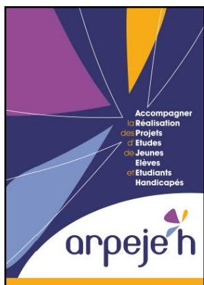
Plaquette de présentation