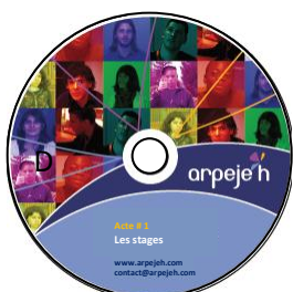
DVD Acte 1 : Les stages

Témoignages de jeunes et de collaborateurs